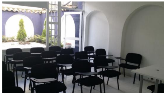
Sede de Corporación Universitaria de Asturias en Bogotá